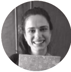
ANALÍA CROTTI Diseño e imagen